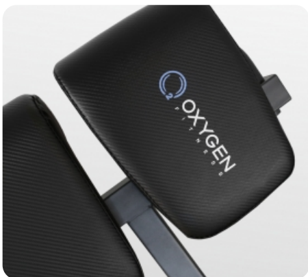
Эргономичное сиденье с поролоновой подушкой