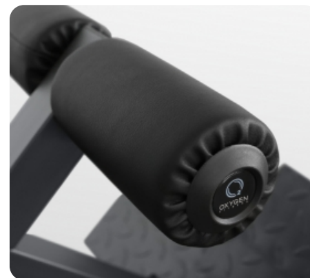
Фирменный логотип OXYGEN FITNESS™ на валиках для ног