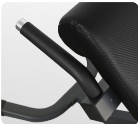
Презиновые антискользящие поручни