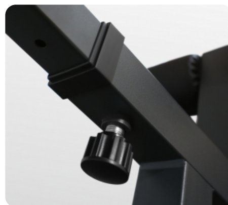
Регулировка по высоте в 4 положениях