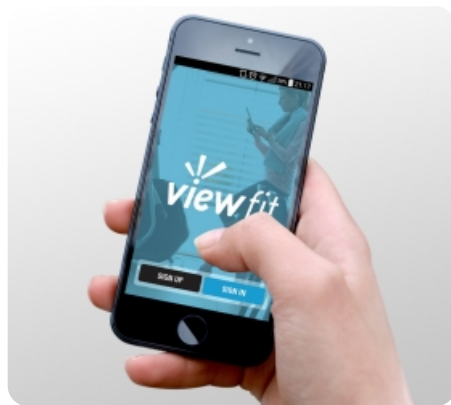
Бесплатное приложения для мониторинга тренировок. Скачивается из AppStore и PlayMarket.

Теги: Домашние электроника , Электроника Horizon