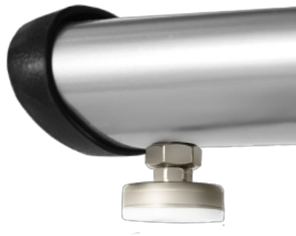
Компенсаторы неровностей пола