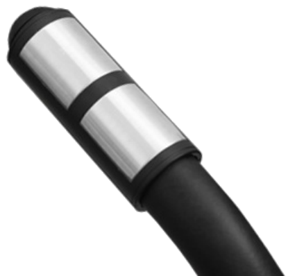
Сенсорные датчики пульса