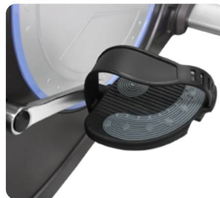
Трехкомпонентный педальный узел и рифленые педали с регулируемыми ремешками