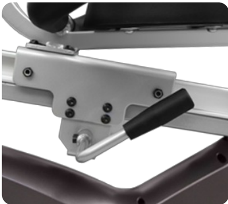
Регулировка сидения по горизонтали