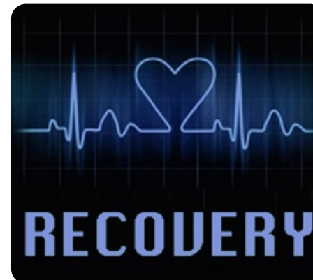
Recovery (оценка восстановления пульса)