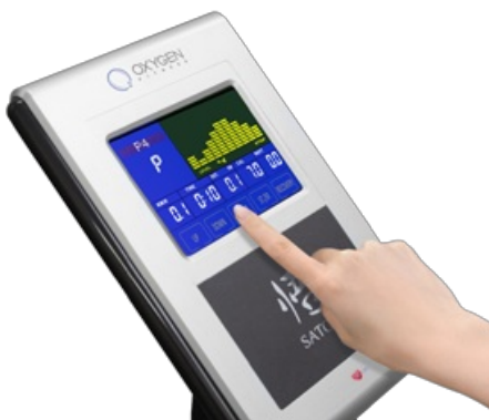
Цветной LCD дисплей с сенсорным управлением (Touch Screen)