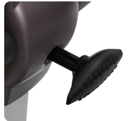
Регулировка положения руля