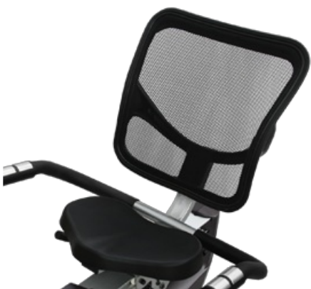
Эргономичное дышащее сеточное сидение с поддержкой спины