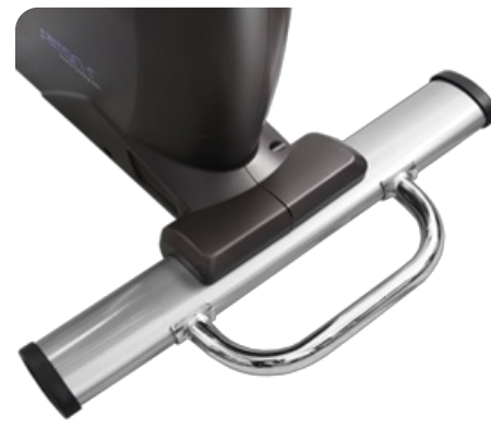
Хромированная рукоятка для удобного перемещения