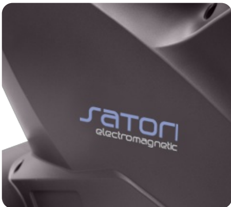
Строгий элегантный дизайн от норвежской студии Strekkgole