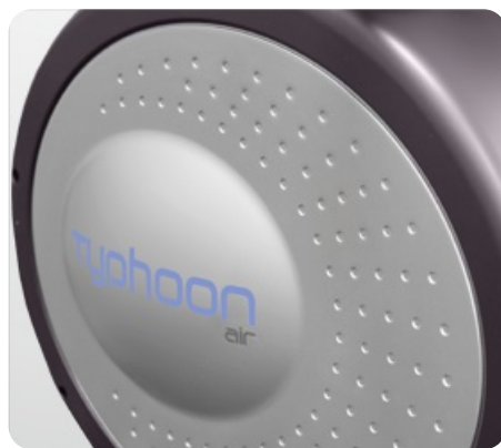
Строгий элегантный дизайн от норвежской студии Strekkogle

Теги: Домашние гребные тренажеры , Гребные тренажеры Охуген