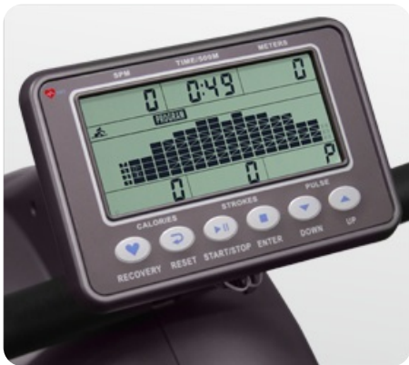
Черно-белый LCD дисплей диагональю 5.5 дюйма (14 см.) с профилем тренировки