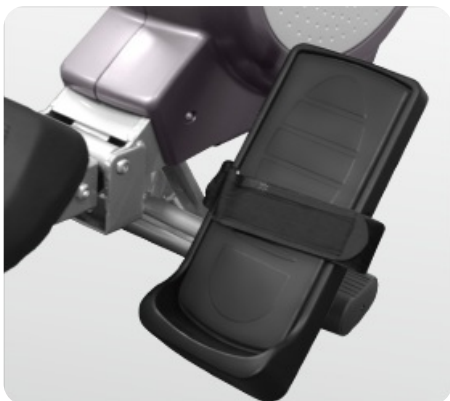
Большие педали с фиксирующими ремешками