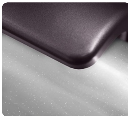
Пластик и металл окрашен красками американской DuPont