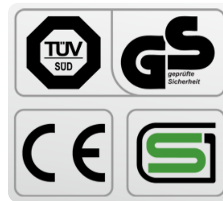
Обязательные сертификаты: европейский CE, немецкий GS TÜV, японский SG