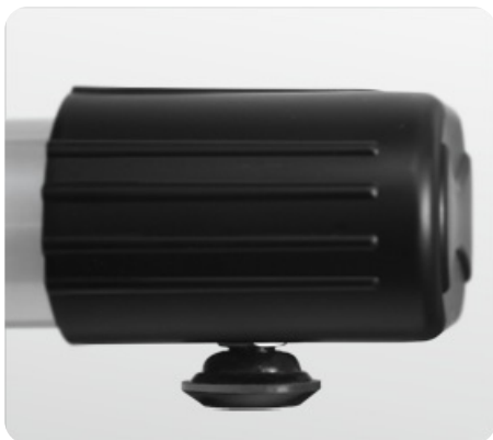
Компенсаторы неровностей пола