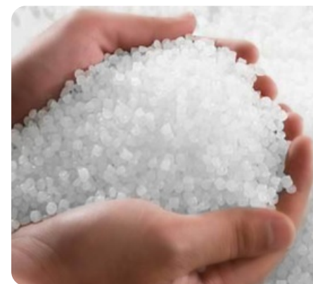
Только "свежие" непереработанные пластмассы